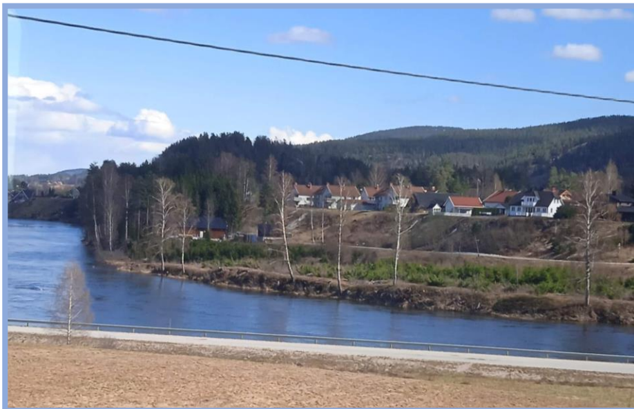
Näkymä junan ikkunasta.

Mietimme eri vaihtoehtoja perille Ognaan pääsemiseksi ja lopulta parhaaksi vaihtoehdoksi osoittautui lento Helsingistä Osloon ja siitä yhdellä junanvaihdolla Ognaan. Junamatka rantarataa pitkin kesti puuduttavat kahdeksan tuntia. Maisemat tosin olivat kerrassaan upeita, vaikka juuri kun olimme ottamassa kuvaa henkeäsalpaavasta näkymästä, juna sukelsi tunneliin ja kuva jäi ottamatta. Eri pituisia tunneleita nimittäin riitti matkalla kymmeniä, mutta silti saimme talletettua kauniita maisemia.