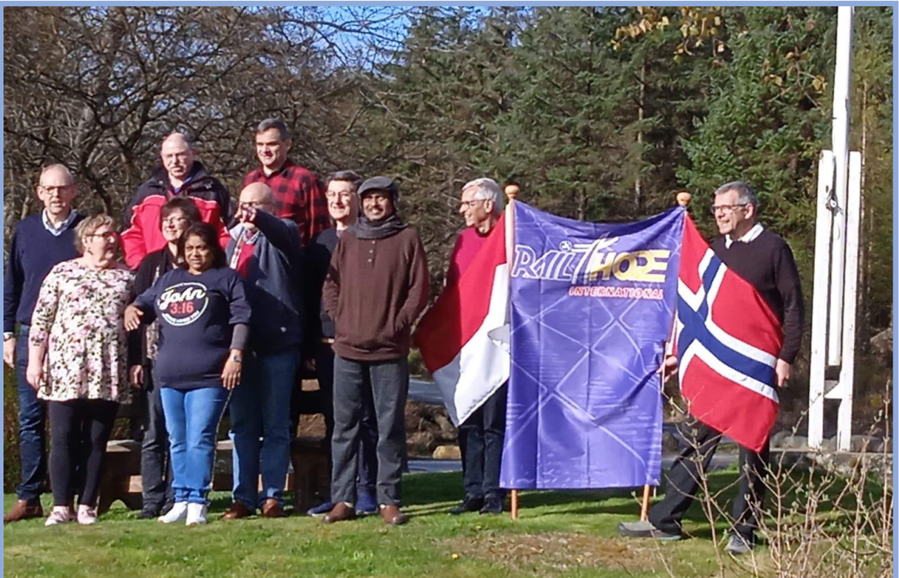
RHI:n viralliset kokousedustajat ryhmäkuvassa Ognatunin pihalla.

Seuraava maanosan konferenssi järjestetään 8.-10.3.2024 Kapkaupungissa, Etelä-Afrikassa ja tapahtuman isäntänä on RailHope Etelä-Afrikka. Virallinen kutsu ja tarkemmat ilmoittautumistiedot julkaistaan seuraavassa Siipipyörässä.