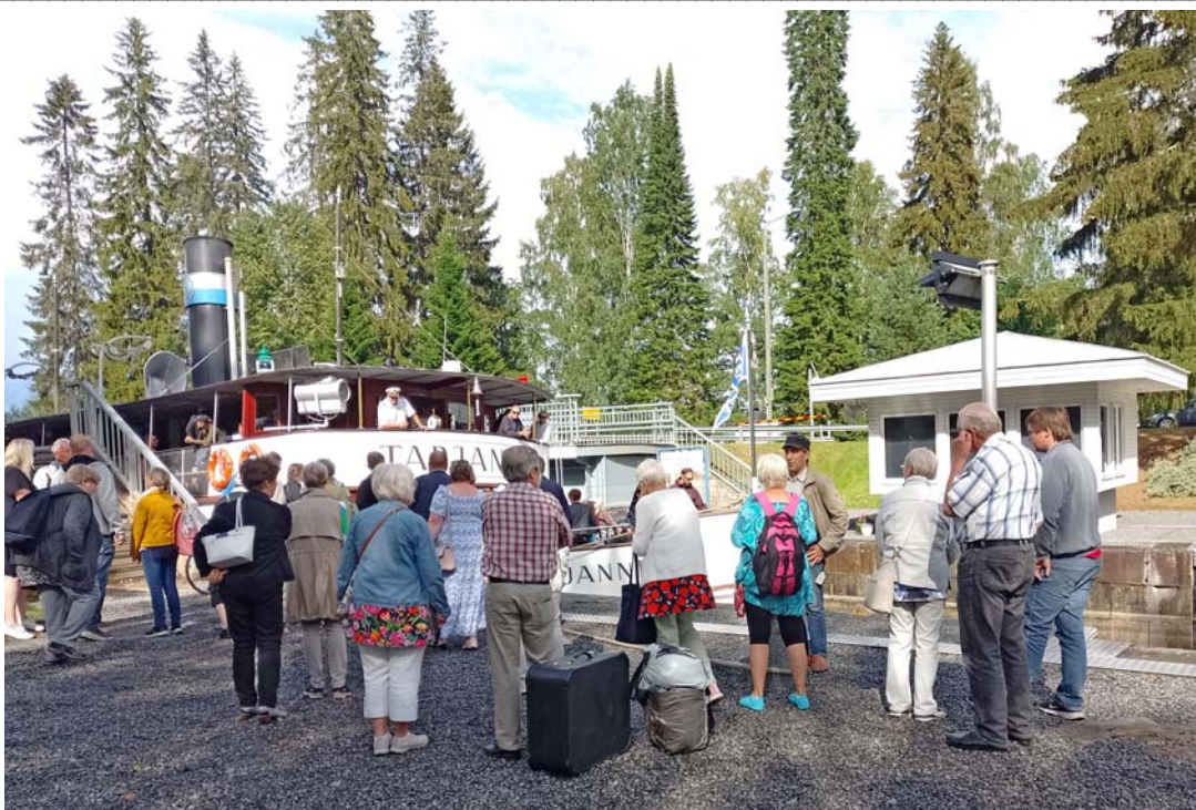
Muroleen kanavalla laivaannousua odotellessa