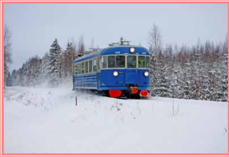
Veturimuseon Lättähattu-kiskoauto tilausajossa Valkeakosken radalla

Silloisten liikenneviraston ja Tampereen teknillisen yliopiston tilauksesta "Jumbo" on palvellut myös testattaessa vaihteita Toijalan ratapihalla