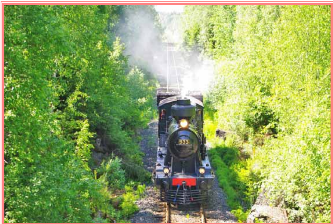
Veturimuseon Jumbo-höyryveturin vetämä museojuna lähestyy syksyistä Valkeakoskea