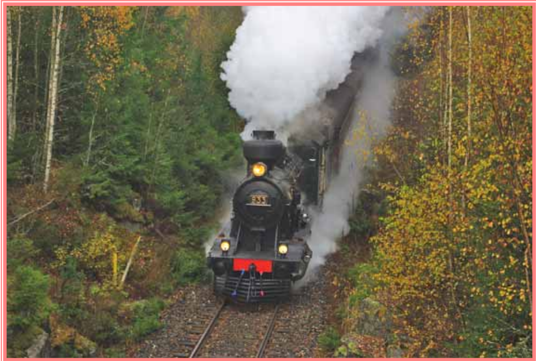
Veturimuseon Jumbo-koeajolla Valkeakoskelle