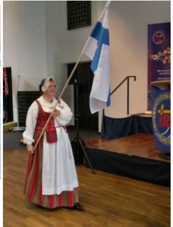
Komeasti saapui maamme lippu avajaisjuhlissa Tuulian kantamana

Junakohtaus Harz vuoristossa. Matkasimme 1141 metrin korkeuteen Brockenille höyryveturilla oikean puoleisella veturilla