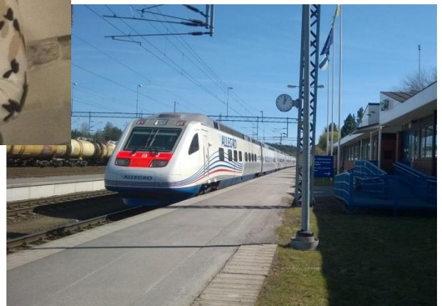
Allegro Vainikkalan asemalla