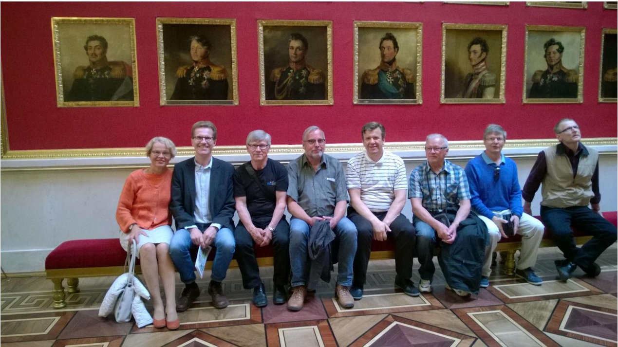
Jumalan sotajoukot maallisten joukkojen johtajia katsellen Eremitaasissa