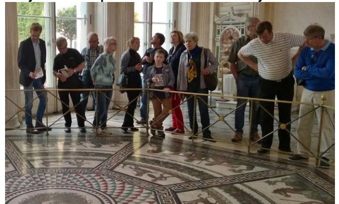
Mosaikin ihailijoita "On niitä kymmeninä tuhansia"