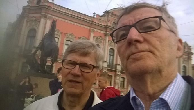
Vetäjät tutkivat karttaa, Missä ollaan

Matka Allegrolla Pietariin oli elämys. Osa matkalaisista nousi matkaan Helsingistä toiset Kouvolasta ja loput Vainikkalasta.